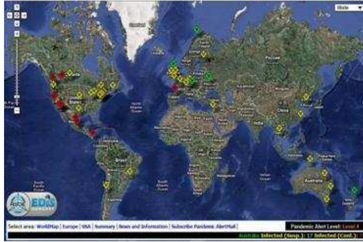
خريطة رصد انتشار انفلونزا الخنازير من جوجل إيرث

لمطالعة خريطة الرصد يمكن زيارة هذا الموقع cette adresse