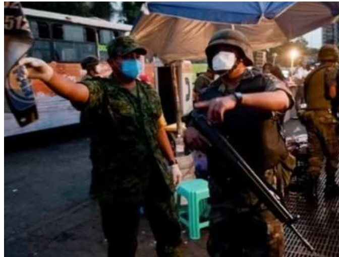
في المكسيك: الاحتياطات اللازمة في الشوارع والتجمعات