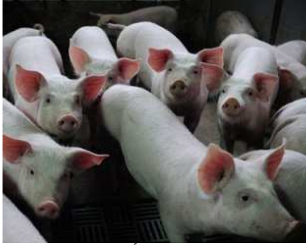
صورة لخنزير في أحد الحظائر