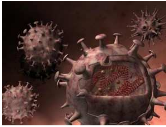
شكل علمي لفيروس أنفلونزا الخنازير (إيه/ايتش1ان1) A/H1N1 gripe porcine

أنفلونزا الخنازير مرض تنفسي ينتشر في مزارع الخنازير، وسببه فيروس أنفلونزا من نوع "إيه" (وهذا النوع قابل للتحويل إلى جائحة على خلاف نوع "بي")، كما أن هذه السلالة (إيه/ايتش1ان1) هي سلالة جديدة لم تكن معروفة من قبل، ويمكن لهذا الفيروس أن ينتشر بسرعة كبيرة.